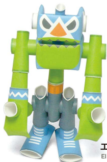
エル・ブルー El Blue