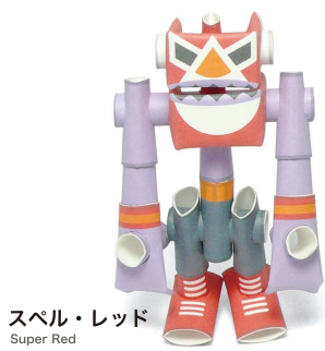
スぺル・レッド Super Red