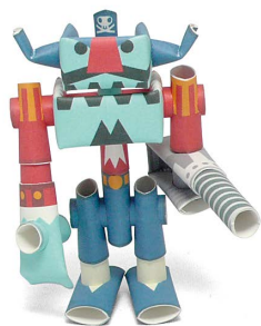
キャプテン・ドリル Captain Drill